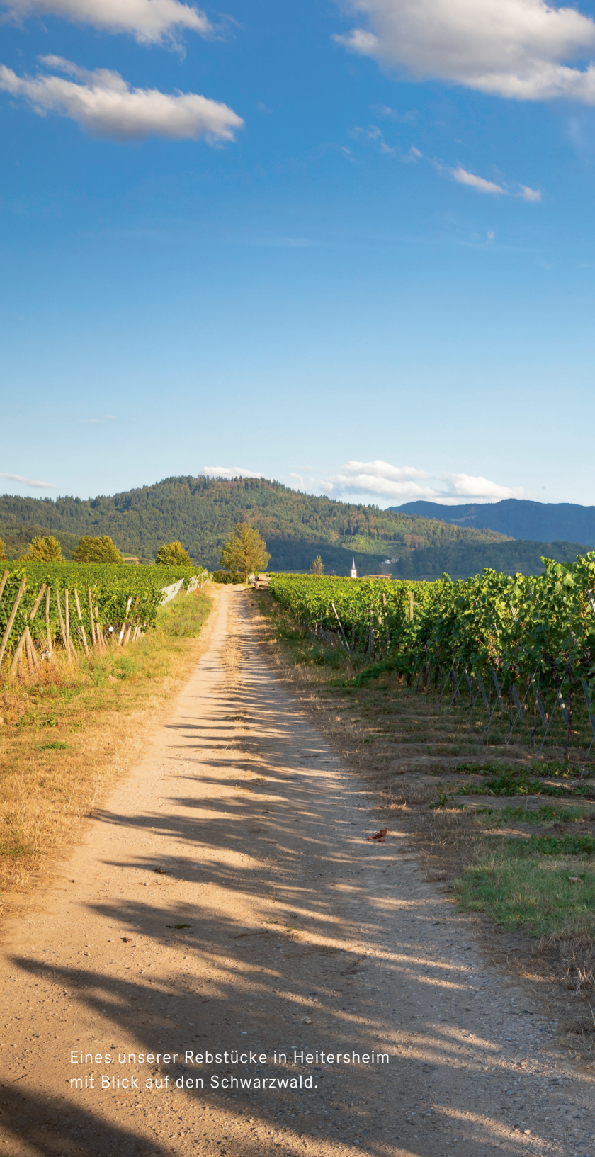
Eines unserer Rebstücke in Heitersheim mit Blick auf den Schwarzwald.